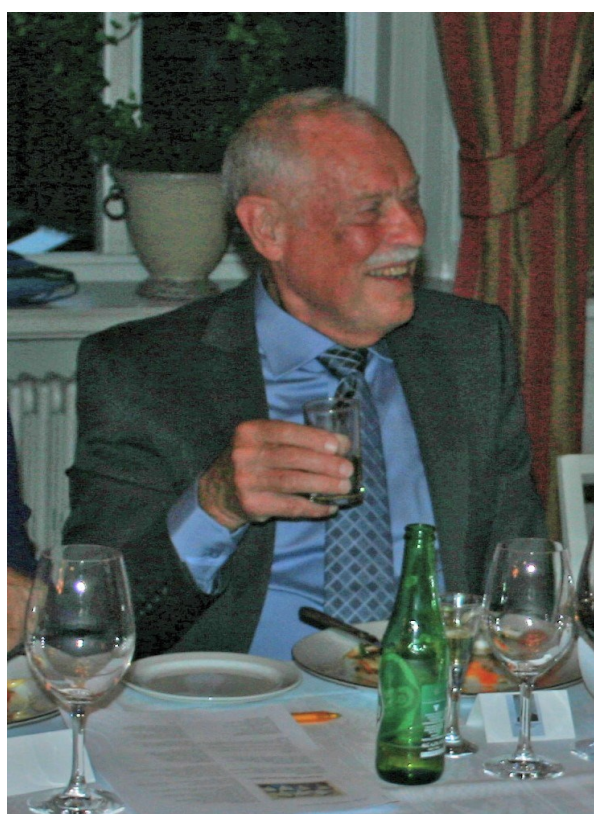
Loppan i högform. Som vanligt roas vi av hans ousinliga skämtlygne. Skål!